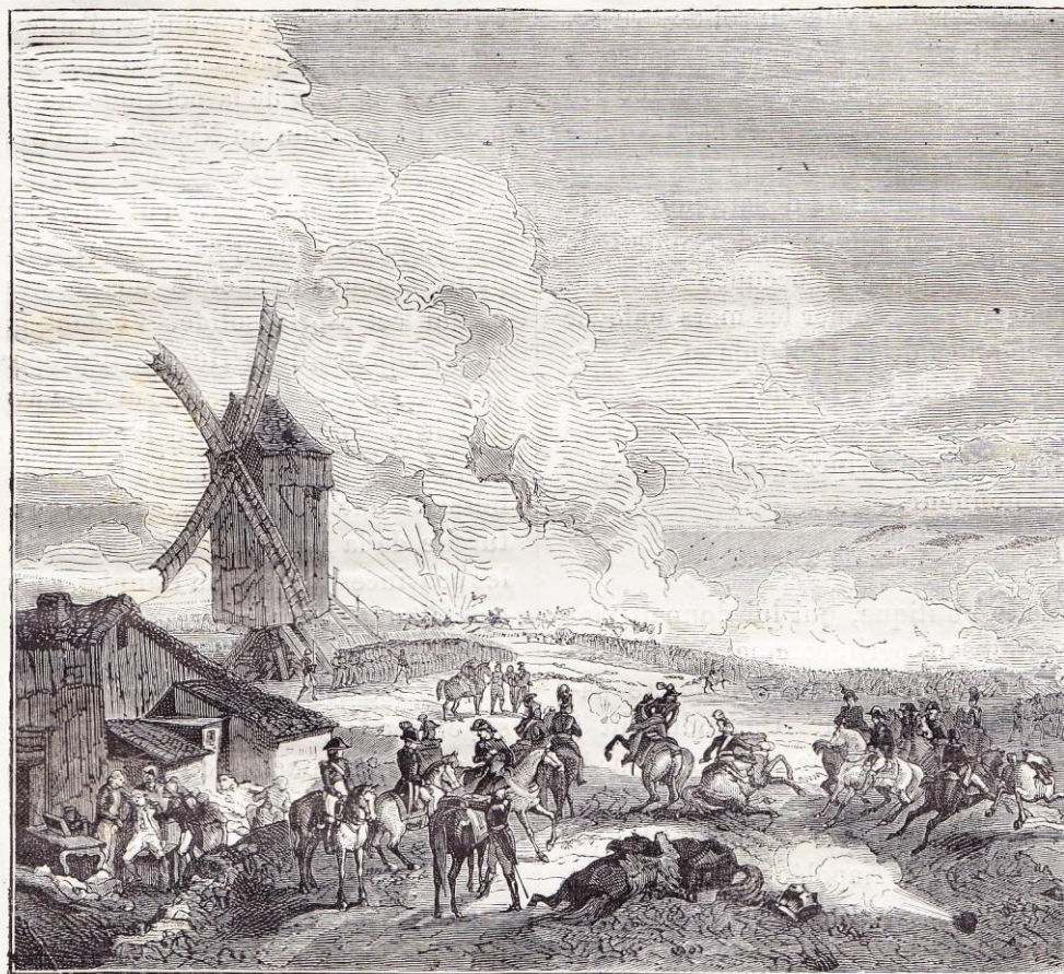
Bataille de Friedland (14 juin 1807.)

l'armée sortait de ses cantonnements; le 5 juin, le général russe, croyant surprendre le corps du maréchal Ney, placé à l'extrême droite, pour l'attirer de ce côté, l'attaqua vigoureusement. Ney exécuta une fière retraite, et amena les Russes sous les coups du gros de l'armée qui les fit reculer à leur tour, les